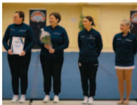
Oulun paikalliskerhon Vuoden urheiluteko -palkinto jaettiin Northern Lights Cheerleadingin kevätnäytöksessä, joka keräsi Kastellin monitoimitaloon noin 800 hengen yleisön.

mukana seuran toiminnassa. Harrastajamäärät olivat vaatimattomat ensimmäisen vuosikymmenen ajan, mutta 2000-luvun alussa NLC alkoi kasvaa voimakkaasti.