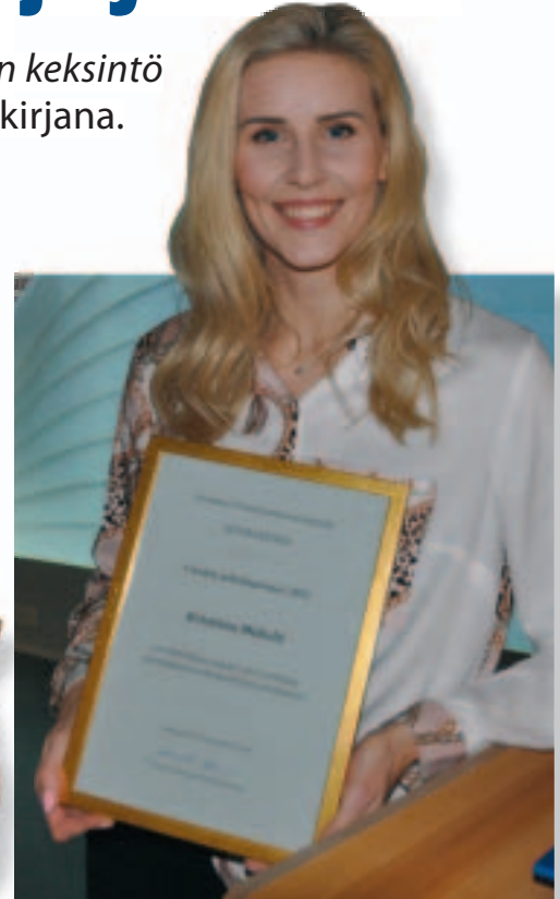
Kolmiloikkaaja Kristiina Mäkelä viimekesäinen Instagram-postaus poiki laajan julkisen keskustelun ja tuli nyt palkituksi Vuoden urheilupostauksena.

Lisäksi Tietokirjallisuuden edistämiskeskus lahjoittaa Vuoden urheilukirja -voittajalle 2000 euron palkintosumman.