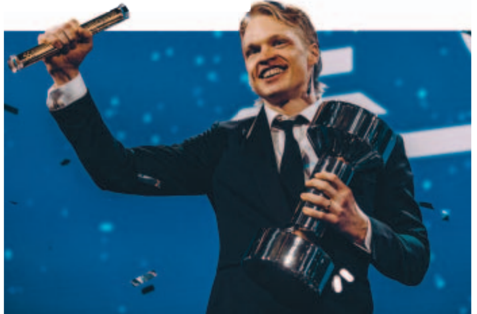
Vuoden urheilija -äänestys on jatkunut katkeamattomana vuodesta 1947 lähtien. Yhteistyön myötä Urheilugaalassa julkistetaan tammikuussa 2024 järjestyksessään 77. Vuoden urheilija.

– Urheilutoimittajain Liiton omistamat palkintoluokat Vuoden urheilija, Vuoden valmentaja, Vuoden nuori urheilija ja Vuoden joukkue ovat Urheilugaalassa urheiluarvostuksen palkintoluokkien ydintä. On merkityksellistä, että juuri nämä palkintoluokkien